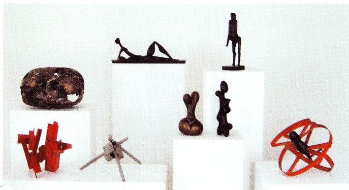
Christoph Freimann (1940 Leipzig – lebt in Stuttgart) Knäuel, 2001 Messing, Lack, 24 x 25 x 24 cm