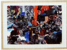
Wolfgang Neumann (1977 Filderstadt – lebt in Ludwigsburg) WROMwrom, 2006 Mischtechnik auf Leinwand, 80 x 100 cm