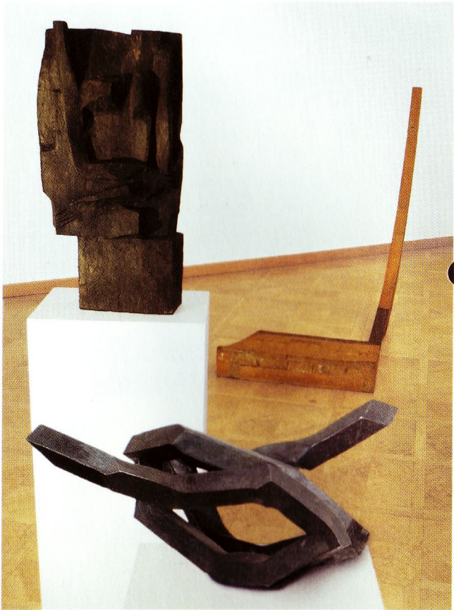
Wilhelm Loth (1920 Darmstadt – 1993 Darmstadt) Torso 4/57 – Hommage á Käthe Kollwitz, 1957 Bronze, 70,5 x 34 x 16 cm