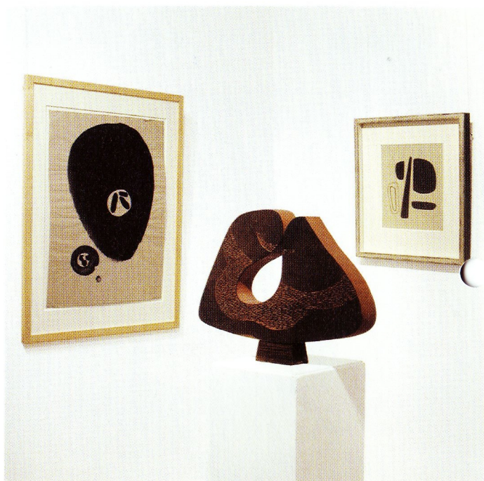
Julius Bissier (1893 Freiburg – 1965 Ascona) Frucht, 1938 Tusche auf grauem Papier, 63 x 46,5 cm