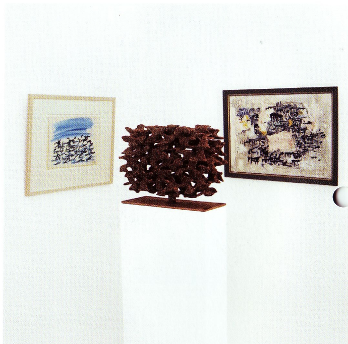
Henri Michaux (1899 Namur – 1984 Paris) Ohne Titel Gouache und Aquarell, 27,8 x 37,5 cm