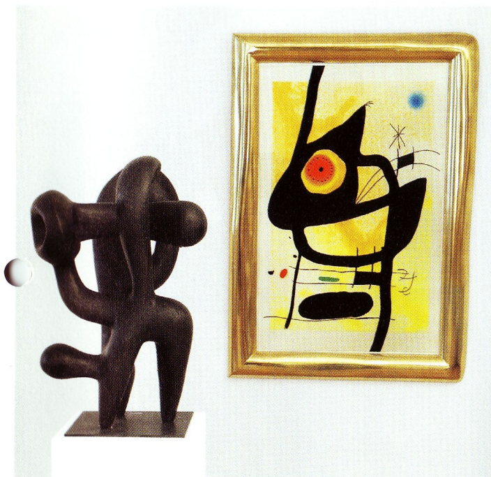
Joan Miro (1893 Barcelona – 1983 Palma de Mallorca) La femme des sables, 1969 Farbradierung mit Aquatinta, 105 x 67 cm