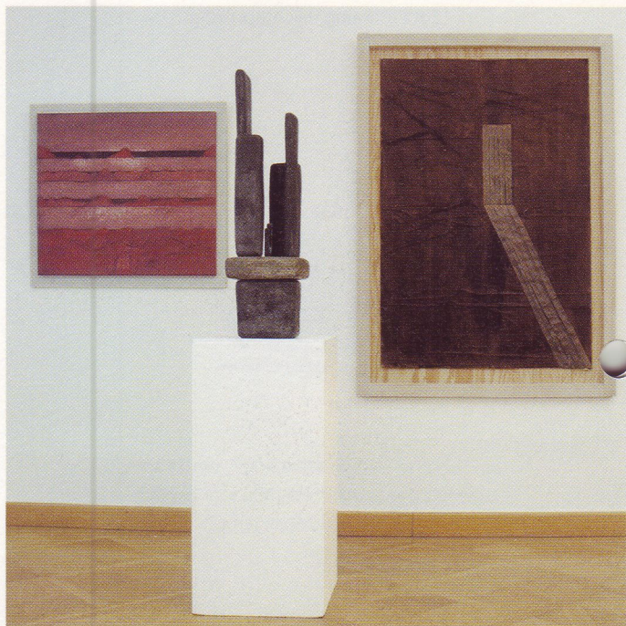
Hans Schreiner (1930 Bad Friedrichshall – lebt in Stuttgart) Stufen zum Horizont, 1992 Mischtechnik auf Leinwand, 65 x 75 cm